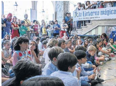
Sesión inaugural en Zaragoza, en el cine Palafox.

El ciclo arranca el 22 de octubre con la película 'Siete ocasiones' de Buster Keaton