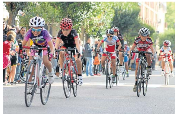
■ Jovencísimos participantes, en una de las pruebas celebradas el año pasado.